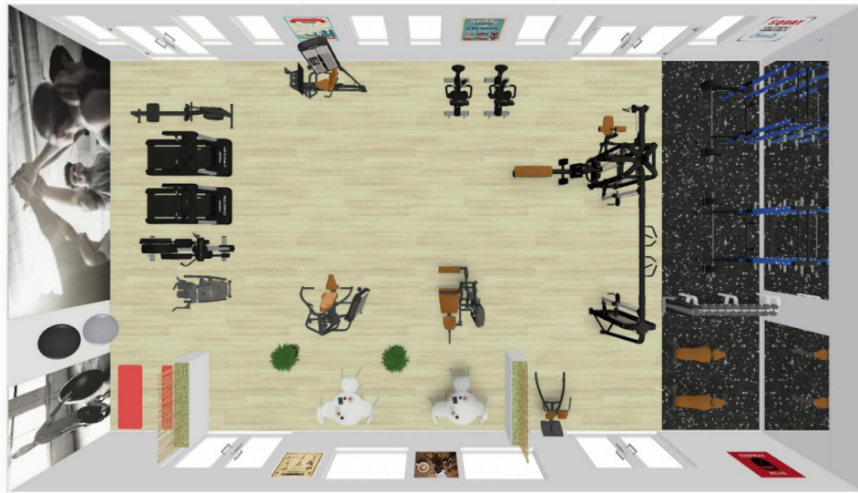
Tidligt forslag til lokale indretning af det gamle fitness-rum – ikke endelig udgave.